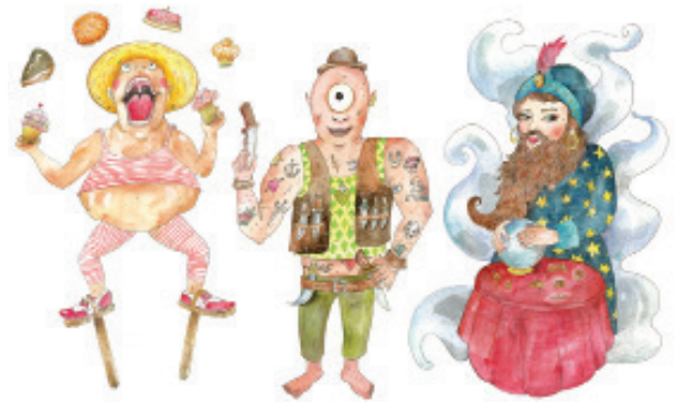
Planche 9 Le Cyclope - (c) Marie Tijou

(La Palène-Rouillac / La Canopée-Ruffec / Les Carmes-La Rochefoucauld-en-Angoumois)